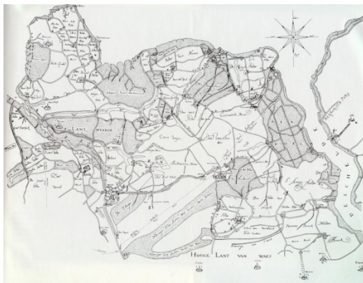
Kaart Hulsterambacht 1575 (Philips II)

In tegenstelling tot de bewering dat in de afgelopen eeuwen zoveel oppervlakte van de Westerschelde is ingedijkt (historisch selectief winkelen), is er juist een groot verlies opgetreden. Zo'n bewering vinden we terug in het rapport natuur doelenprofiel Westerschelde t.b.v. Natura 2000 in 2008 in opdracht van het ministerie geschreven door Arcadis. Er wordt gesteld dat de oppervlakte van de Westerschelde in 1600 2x zo groot was als nu, en in 1800 1,5x zo groot. Dit is zeer suggestief en uit haar context gehaald. Enerzijds suggestief omdat het Natura 2000 gaat om de situatie op het moment van aanmelden van het natuurgebied van Europees belang. Ingrepen uit het verleden staan daar terecht buiten, omdat men anders de gehele situatie van vroeger zou moeten terugbrengen. Volslagen onmogelijk. Anderzijds omdat de keuze gemaakt wordt door het moment dat Zeeuws-Vlaanderen voor 75% om militaire redenen geïndeerd was en de veroorzaakte komberging geen Westerschelde is. In 1575 waren alle dijken van Zeeuws-Vlaanderen langs de Westerschelde op orde. De oppervlakte van de Westerschelde was toen duidelijk veel minder dan nu.